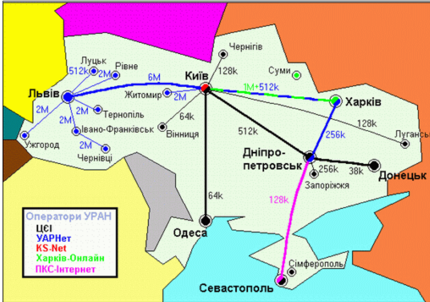
Рис. 4. Розташування ресурсно-операційних вузлів UGrid

туалізації ресурсів звичайних персональних комп'ютерів за допомогою Grid-технологій. Довкола кожного провідного університету регіону групуються місцеві вищі навчальні заклади (ВНЗ), так що реальна кількість ВНЗ, які задіяні в Ugrid-проекті, перевищує 30.