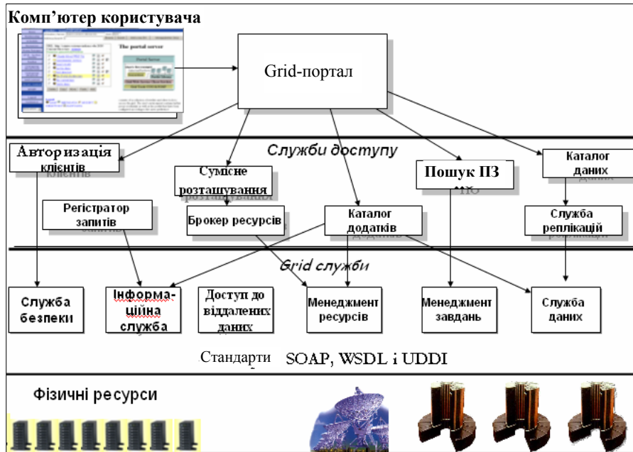
Рис. 2. Структура сервісів ПГЗ

Grid припускає колективний режим доступу до ресурсів і до пов'язаних з ними послуг (сервісів) у рамках глобально розподілених віртуальних організацій, які спільно використовують загальні ресурси. При цьому Grid визначає без допомоги користувача найбільш відповідне джерело даних і виконує їх аналіз, знайшовши найкраще місце для запуску відповідної програми на комп'ютерах, які простоюють. Якщо ж необхідно провести такий аналіз в інтерактивному режимі кількома користувачами із різних країн світу, то Grid зв'яже їхні комп'ютери так, що спільна робота не буде відрізнятися від роботи в локальній мережі. При цьому не треба хвилюватися про безліч паролів — Grid здатний зрозуміти, хто має право брати участь у спільній роботі. Для управління ресурсами і задачами Grid має інформаційну службу. Для управління ресурсами і розміщення задач використовується брокер ресурсів, і все це підтримується локальним диспетчером задач комп'ютерного кластера.