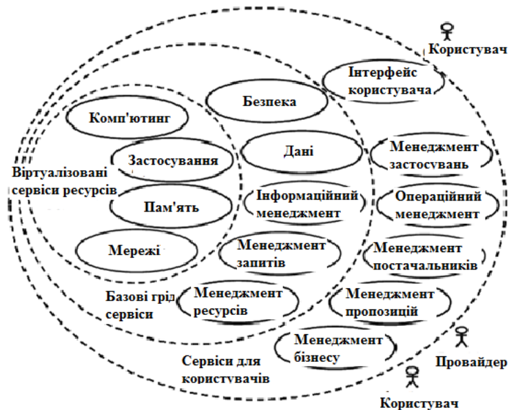
Рис.2. Концептуальна модель об'єднання грід- і хмарних послуг

Хмари можуть успішно використовуватися в якості локальних ресурсів, а Грід об'єднувати ці ресурси в національні е-інфраструктури (рис.2) [2,6]. Тому доцільно дослідити наслідки використання хмарних технологій (наприклад, віртуалізації) в існуючих грід-інфраструктурах, з одного боку, і можливості побудови грід-сервісів поверх віртуальних інфраструктур, з другого.